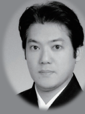
Jutaichiro HANAYAGI 花柳寿太郎