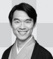
柳家花緑 Karoku YANAGIYA