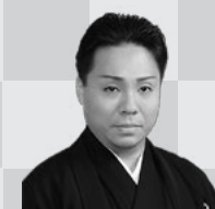
藤間勘十郎 Kanjuro FUJIMA

演出・振付：藤間勘十郎 監修：大島幸久 美術：後藤順二 照明：森 学 音響：畑中富雄 映像：柏原晋平 新谷暢之 殺陣：井上謙一郎 演出助手：中屋敷法仁 舞台監督：瀬尾健児 制作協力：藤間オフィス ミー&ハーコーポレーション ゴーチ・ブラザーズ 制作：明治座