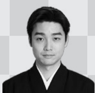
尾上菊之丞 Kikunojo ONO