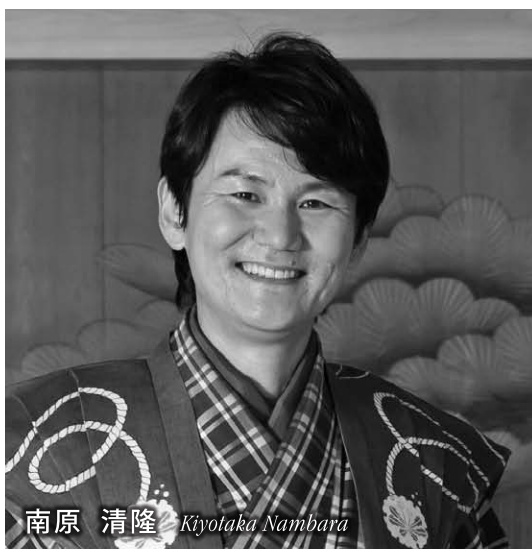
南原 清隆 Kiyotaka Nambara