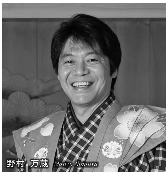
野村 万蔵 Manzo Nomura