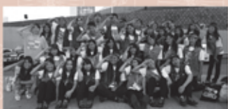
都立足立新田高等学校

都内3校のダンス部が「和の心」をモチーフにしたダンスを創作。ストリート系ダンスと歌舞伎役者・坂東新悟指導による日本の所作のコラボレーションで、新たなダンス・パフォーマンスを披露します。