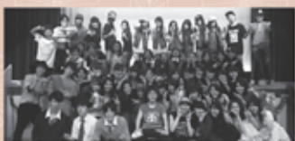
都立高島高等学校