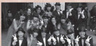
都立清瀬高等学校