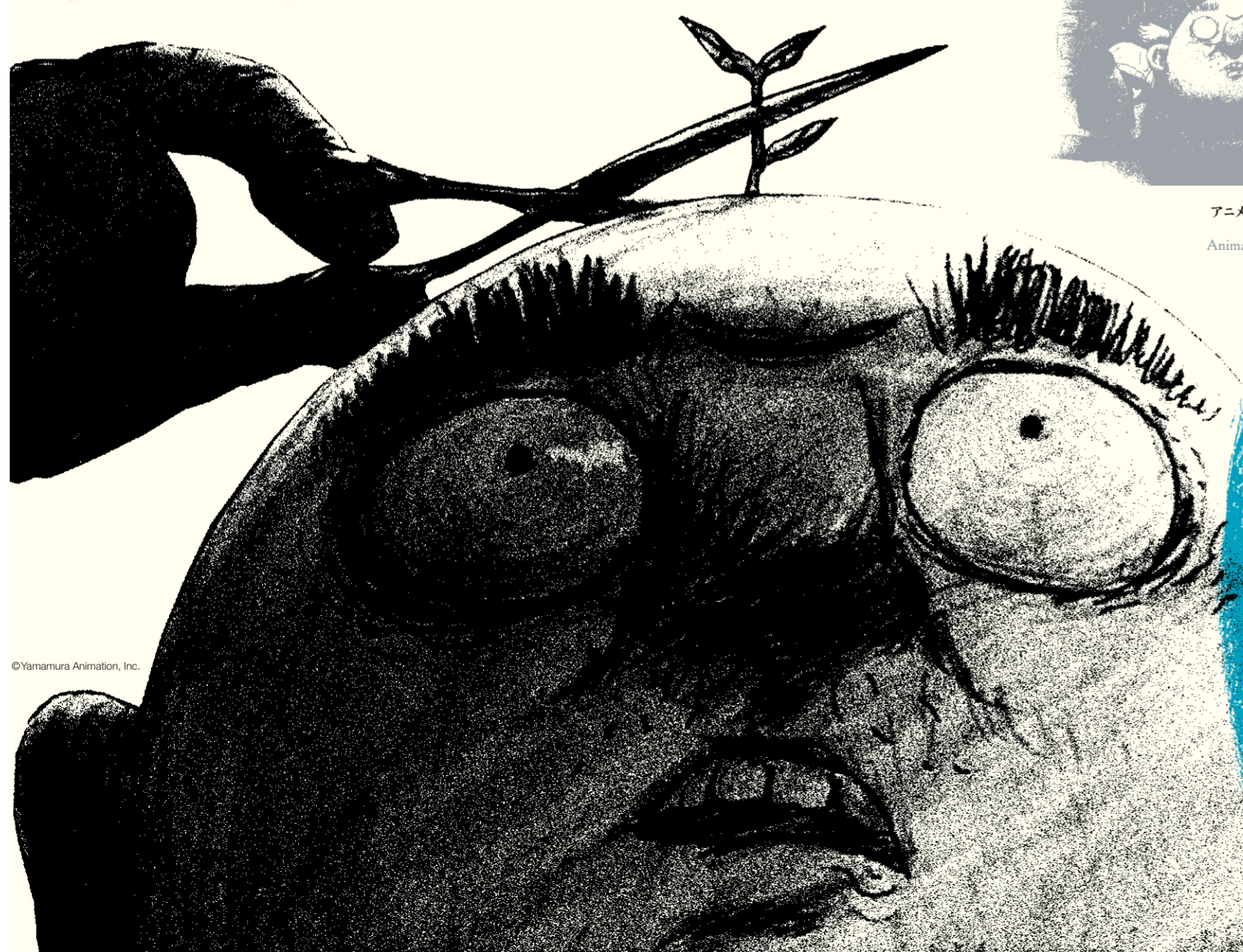
アニメーション—山村浩二 Animation—Koji Yamamura