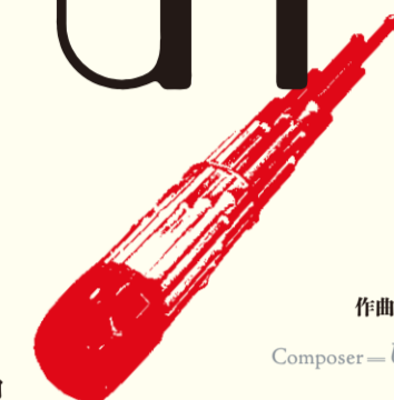
作曲—鳥養潮 Composer—Ushio Torikai