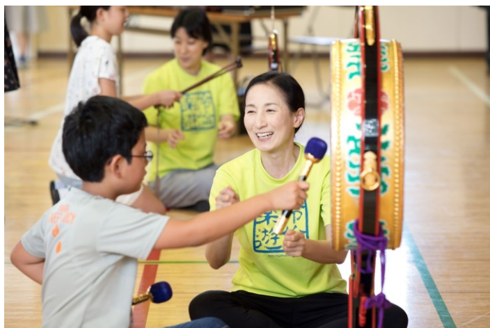
子供のための伝統文化・芸能体験事業