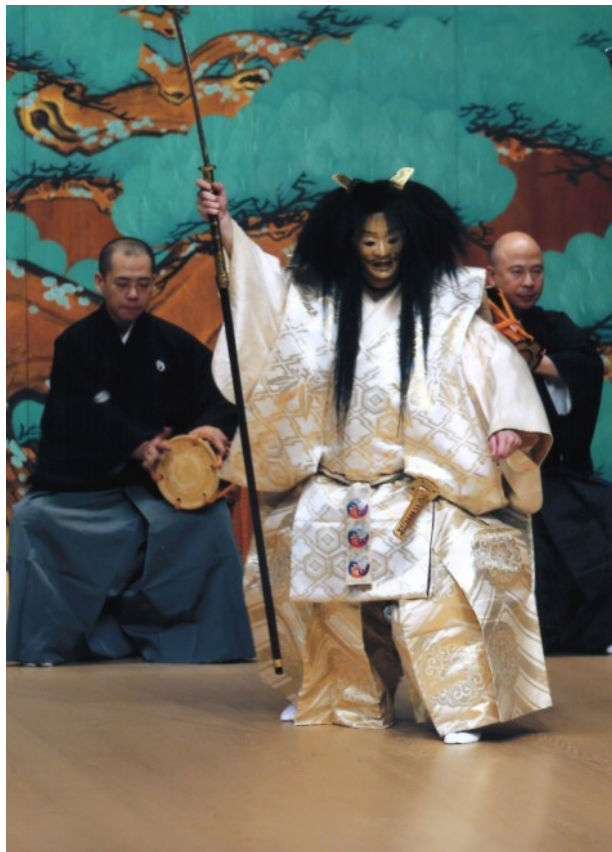
能「船弁慶」